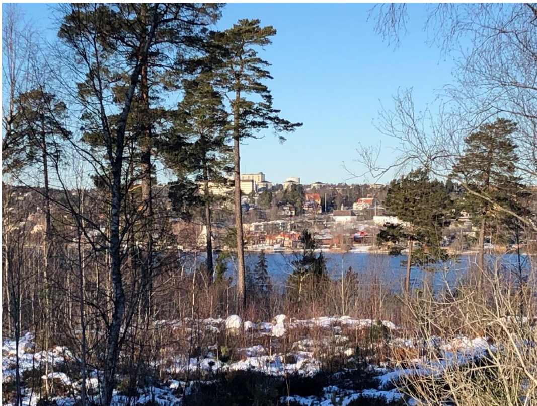
Bild från stenkrossens planerade verksamhetsområde (yta B). På andra sidan ligger Nacka sjukhus och Saltsjö-Duvnäs. Dygnet runt kommer ljudnivåer som överskrider en rockkonsert eller ljudet från en ambulans spridas från den här platsen som ligger högre än den omgivande bebyggelsen.

Som du sade då: Nacka ska vara en grön och attraktiv kommun och vi vill bevara våra lugna och gröna boendemiljöer. Stenkrossar behövs, men de måste lokaliseras till platser som inte stör kringboende!